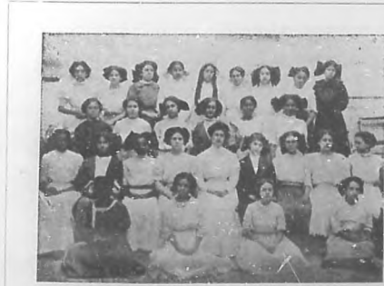
Grupo de alumnas de la Escuela número 31.