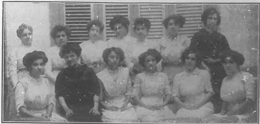
Señorita Directora y Maestras de la Escuela Pública de niñas número 8.