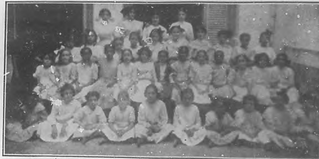
Grupo de alumnas de la Escuela número 8.