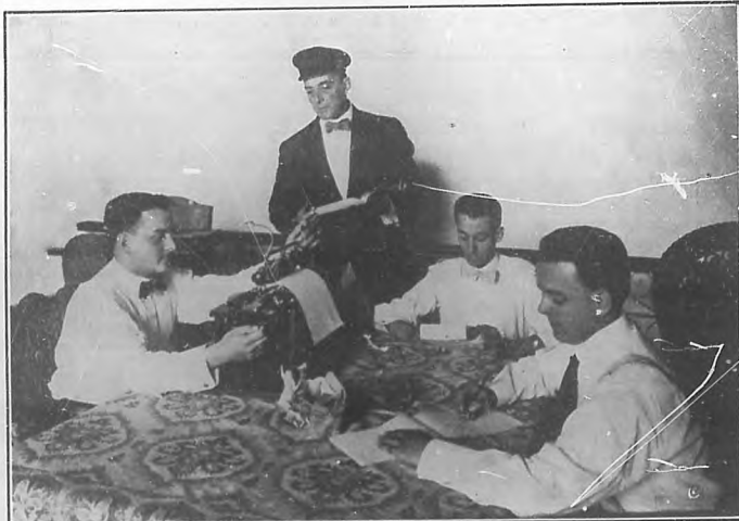
El notable actor Regino López, en el salón de estudios de sus hijos Armando, Regino y Oscar.

Mas no hablemos por hoy de ello en esta sección; dejemos lugar a Regino padre ejemplo para ocuparnos otro día del artista.