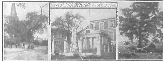
1. Pino de Washington, en Cambridge, a cuya sombra tomó el fundador de la república americana, en 1776, el juramento del ejército libertador... 2. Arbol bajo el cual se celebró la primera misa en la ciudad de la Habana... 3. Arbol de la Paz, cerca de Santiago de Cuba...