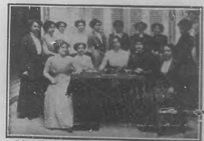
Señora Directora y Maestras de la Escuela Pública de niñas número 8.