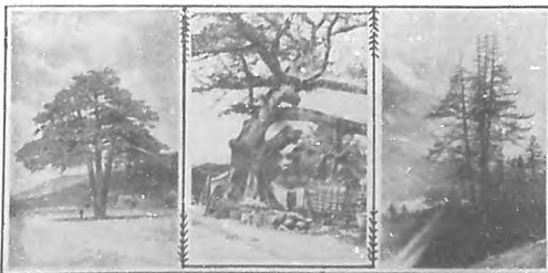
1. 'El Pi de las tres brancas' (Pino de las tres ramas), propiedad de la Univ. C. Catalana... 2. Arbol secular de Santo Domingo... 3. Magnifico alerce de 2.000 años de existencia que arraiga en el valle de Courmayeur...